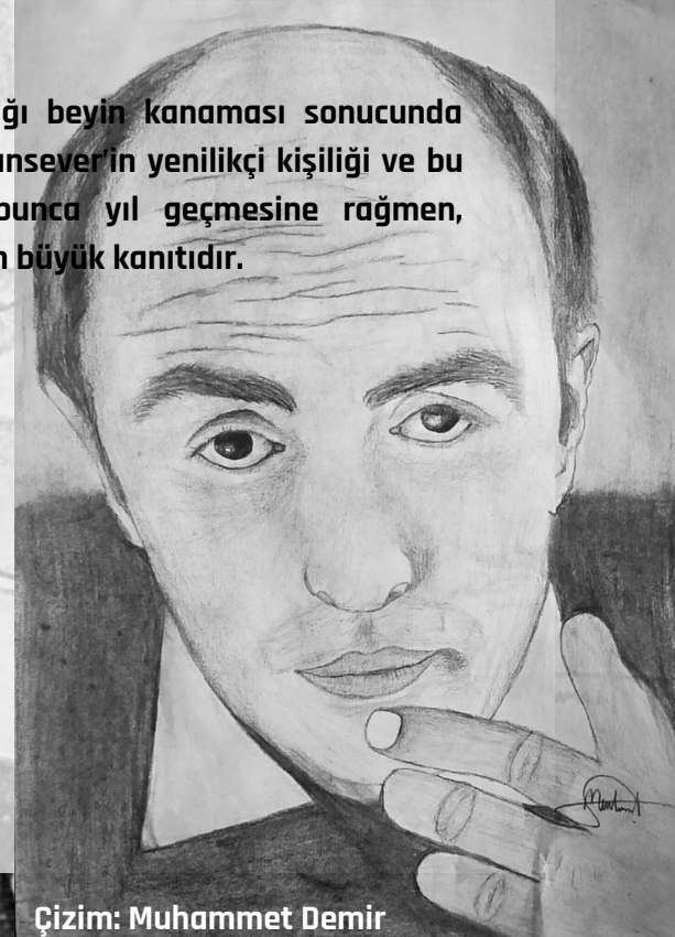
Çizim: Muhammet Demir

Cansever, 1986 yılında Bodrum’da tatilde iken yaşadığı beyin kanaması sonucunda hayata veda etmiştir. Mezarı ise Rumelihisarı’ndadır. Cansever’in yenilikçi kişiliği ve bu kişiliğini eserlerine yansıtması, vefatının ardından bunca yıl geçmesine rağmen, günümüzde de adından ve şiirlerinden söz edilmesinin en büyük kanıtıdır.